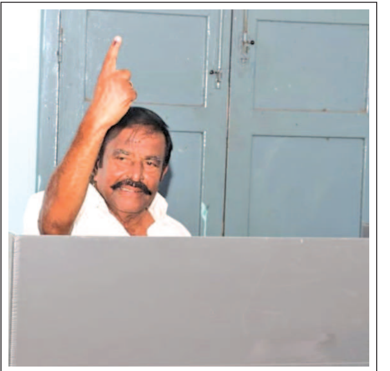
திருச்சி தில்லை நகரில் உள்ள மக்கள் மன்றத்தில் கழக முதன்மைச் செயலாளரும் மேற்கு தொகுதி சட்டமன்ற வேட்பாளருமான கே.என்.நேரு அவர்கள் தனது வாக்கை பதிவு செய்தார்