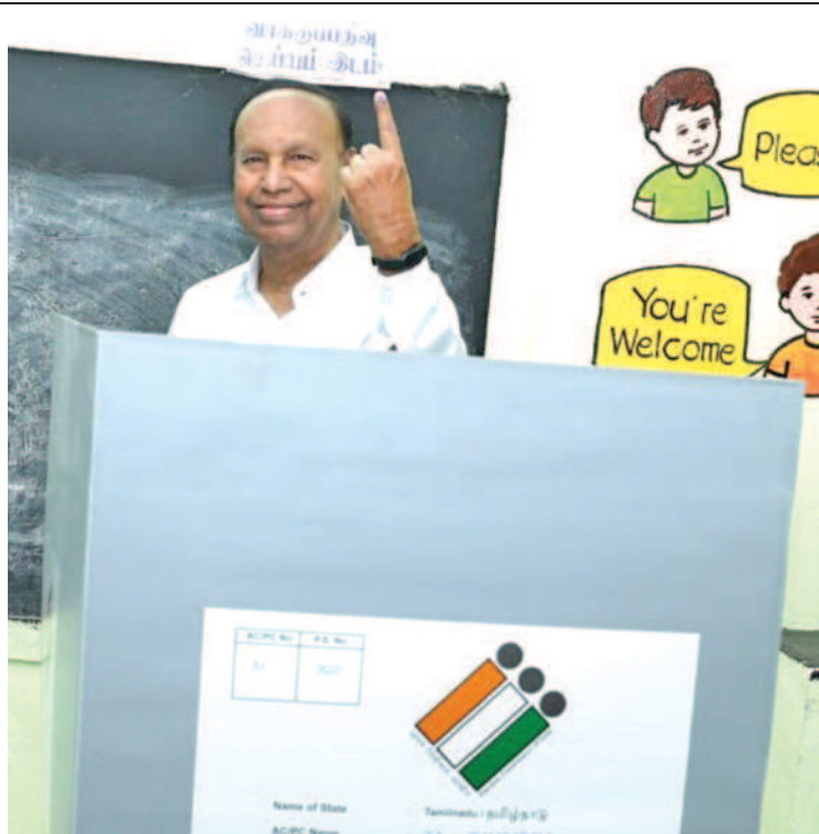
தி.மு.க. பொருளாளரும் மக்களவை குழு தலைவருமான டி.ஆர். பாபு அவர்கள் நேற்று காலை சரியாக 7:00 மணிக்கு தாம்பரம் சட்டமன்ற தொகுதியில் உள்ள பிரக்கள் கரணை வாக்குச் சாடியில் தன்னுடைய வாக்கினை அளித்தார்.

பாசிசத்தை வீழ்த்த திராவிட மாடல் ஒன்றே - ஒற்றை மருந்து. எடல்லியின் ஆதிக்கத்தை தடுக்க மு.க.ஸ்டாலின் ஒருவரே வலியுறுத்த தலைவர். இவரால்தான் தமிழ்நாட்டை பாதுகாக்க முடியும்.