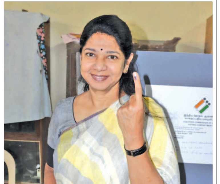
கழக துணைப் பொதுச் செயலாளர் கனிமொழி கருணாநிதி எம்.பி., அவர்கள் நேற்று காலை சென்னை இராத்தாகிருஷ்ணன் சாலையில் உள்ள தூய அப்பாஸ் பள்ளியில் தமது வாக்கினை பதிவு செய்தார்.