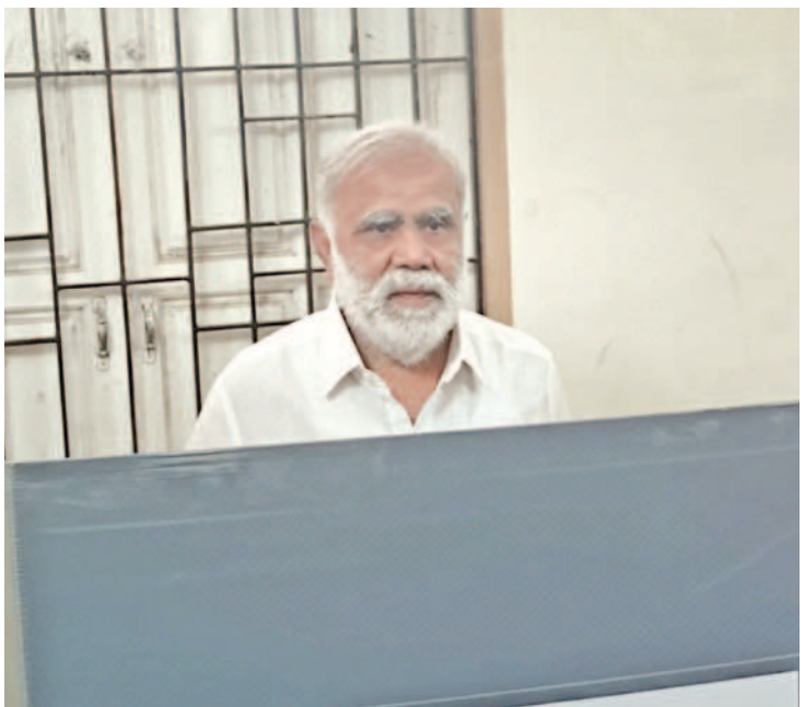
ஆத்தூர் சட்டமன்ற தொகுதி கழக வேட்பாளர் அமைச்சர் இ.பெரியசாமி திண்டுக்கல்லில் தனது வாக்கினை பதிவு செய்தார்.