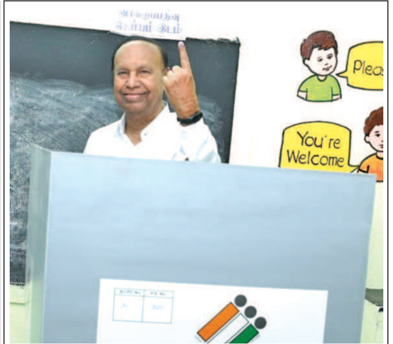
தி.மு.க. பொருளாளரும் மக்களவை குழு தலைவருமான டி.ஆர். பாலு அவர்கள் நேற்று காலை தாம்பரம் சட்டமன்ற தொகுதியில் உள்ள பீர்க்கன் கரணை வாக்குச் சாவடியில் தன்னுடைய வாக்கினை அளித்தார்.