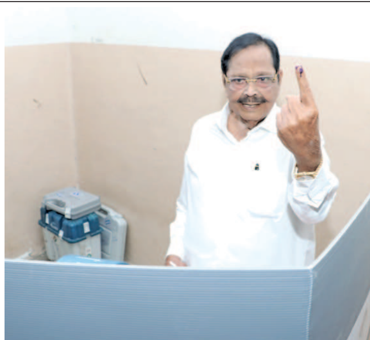
வேலூர் மாவட்டம் காட்பாடி சட்டமன்றத் தொகுதி மதச்சார்பற்ற முற்போக்கு கூட்டணி சார்பில் போட்டியிடும் திமுக வேட்பாளர், கழகப் பொதுச் செயலாளர் - அமைச்சர் துரைமுருகன் அவர்கள் டான்பாஸ்கோ பள்ளியில் தனது வாக்கை செலுத்தினார்.