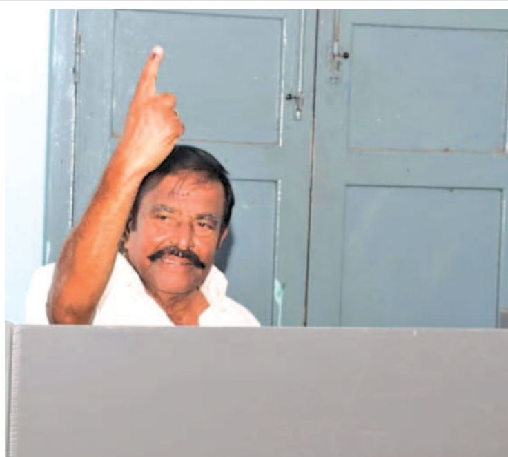
திருச்சி தில்லை நகரில் உள்ள மக்கள் மன்றத்தில் கழக முதன்மைச் செயலாளரும் மேற்கு தொகுதி சட்டமன்ற வேட்பாளருமான அமைச்சர் கே.என்.நேரு அவர்கள் தனது வாக்கை பதிவு செய்தார்