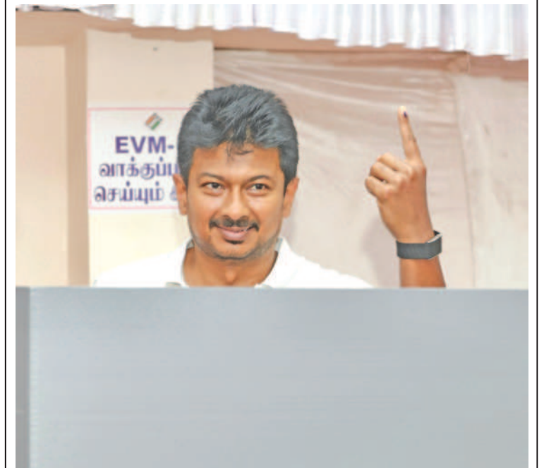
துணை முதலமைச்சர் உதயநிதி ஸ்டாலின் அவர்கள் நேற்று (23.4.2026) சட்டமன்ற தேர்தலையொட்டி சென்னை எஸ்.ஐ.டி. கல்லூரியில் அமைக்கப்பட்டுள்ள வாக்குச் சாவடியில் தனது வாக்கினை பதிவு செய்து, ஜனநாயகக் கடமையாற்றினார்.