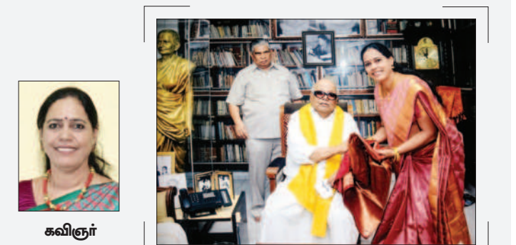
கவிஞர் ஆதிரா முல்லை