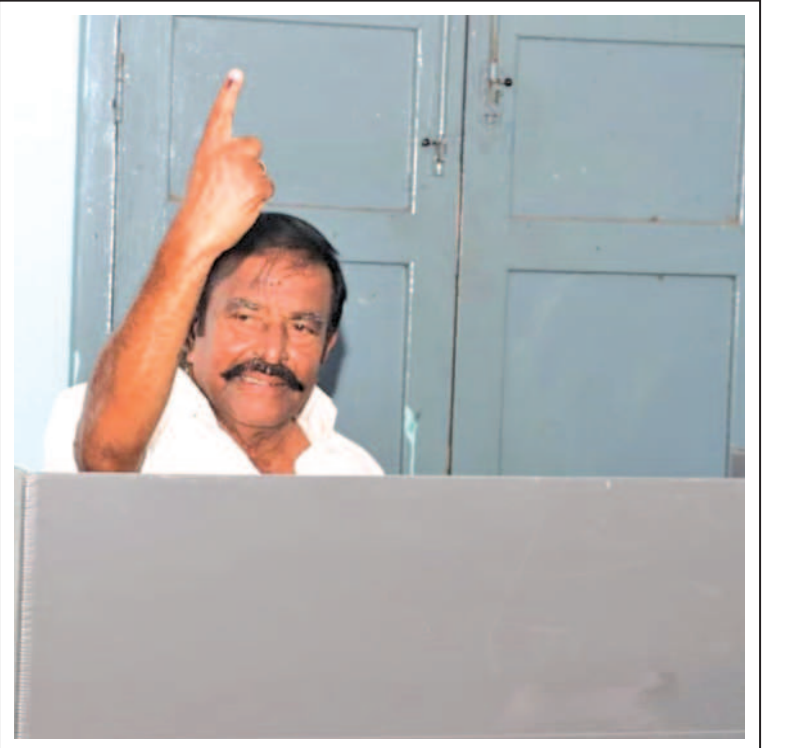
திருச்சி தில்லை நகரில் உள்ள மக்கள் மன்றத்தில் கழக முதன்மைச் செயலாளரும் மேற்கு தொகுதி சட்டமன்ற வேட்பாளருமான கே.என்.நேரு அவர்கள் தனது வாக்கை பதிவு செய்தார்