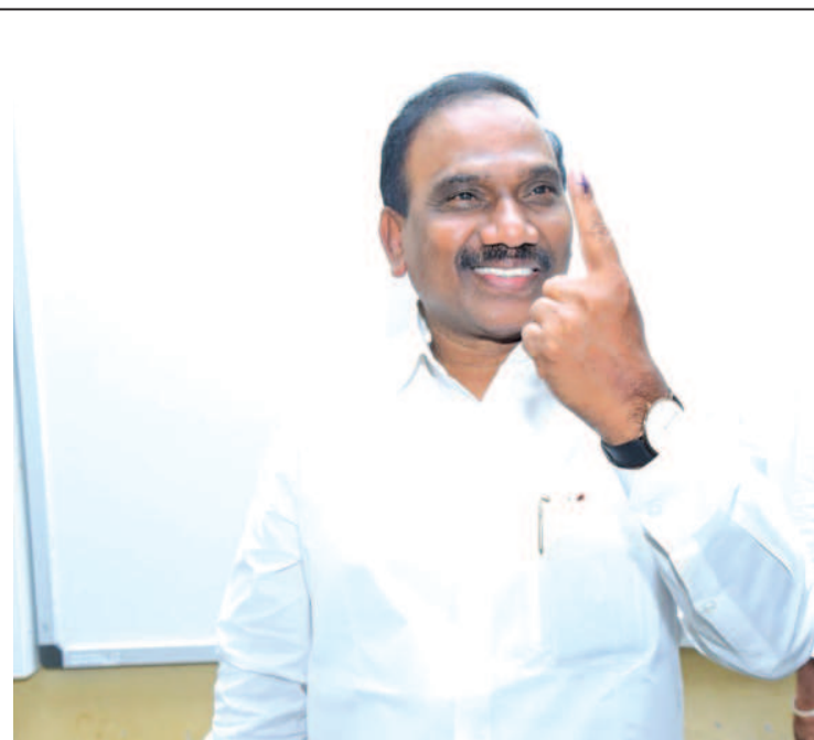
கழக துணைப் பொதுச் செயலாளர் ஆ.இராசா எம்.பி., அவர்கள் பெரம்பலூர் மாவட்டத்திலுள்ள தமது சொந்த கிராமமான வேலூரில் உள்ள உயர்நிலைப் பள்ளியில் வாக்களித்தார்.