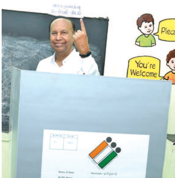
தி.மு.க. பொருளாளரும் மக்களவை குழு தலைவருமான டி.ஆர். பாபு அவர்கள் நேற்று காலை சரியாக 7:00 மணிக்கு தாம்பரம் சட்டமன்ற தொகுதியில் உள்ள பிரிக்கன் கரணை வாக்குச் சாடியில் தன்னுடைய வாக்கினை அளித்தார்.

பாசிசத்தை வீழ்த்த திராவிட மாடல் ஒன்றே - ஒற்றை மருந்து. எடல்லியின் ஆதிக்கத்தை தடுக்க மு.க.ஸ்டாலின் ஒருவரே வலியுயராத தலைவர். இவரால்தான் தமிழ்நாட்டை பாதுகாக்க முடியும்.