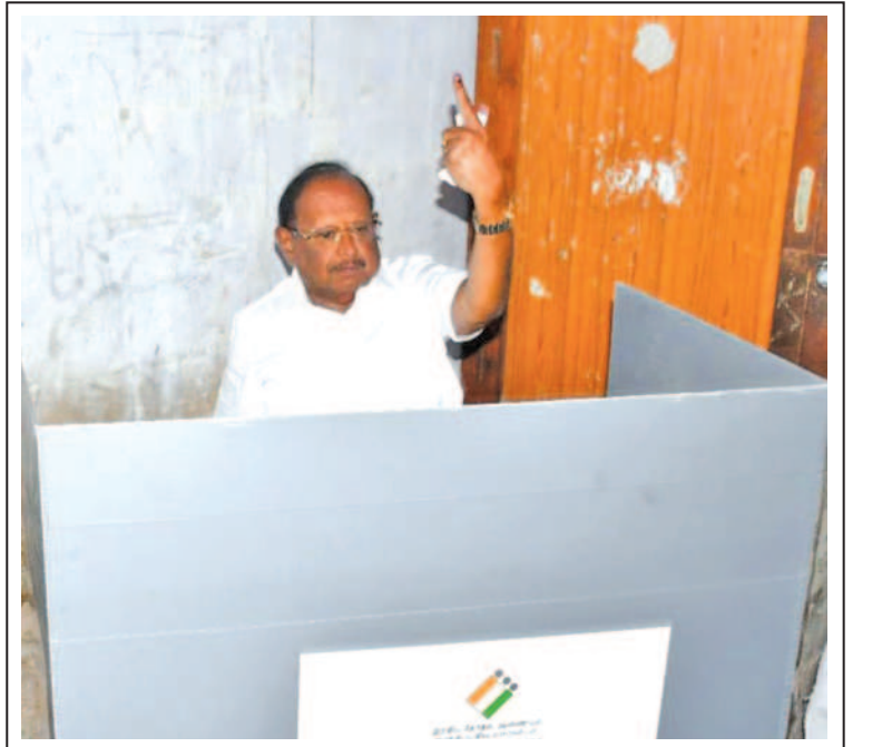
புதுக்கோட்டை இராணியார் அரசினர் மகளிர் உயர்நிலைப் பள்ளியில் திருமயம் சட்டமன்றத் தொகுதி தி.மு.க. வேட்பாளரும், அமைச்சருமான எஸ்.ரகுபதி தனது வாக்கினை பதிவு செய்தார்.