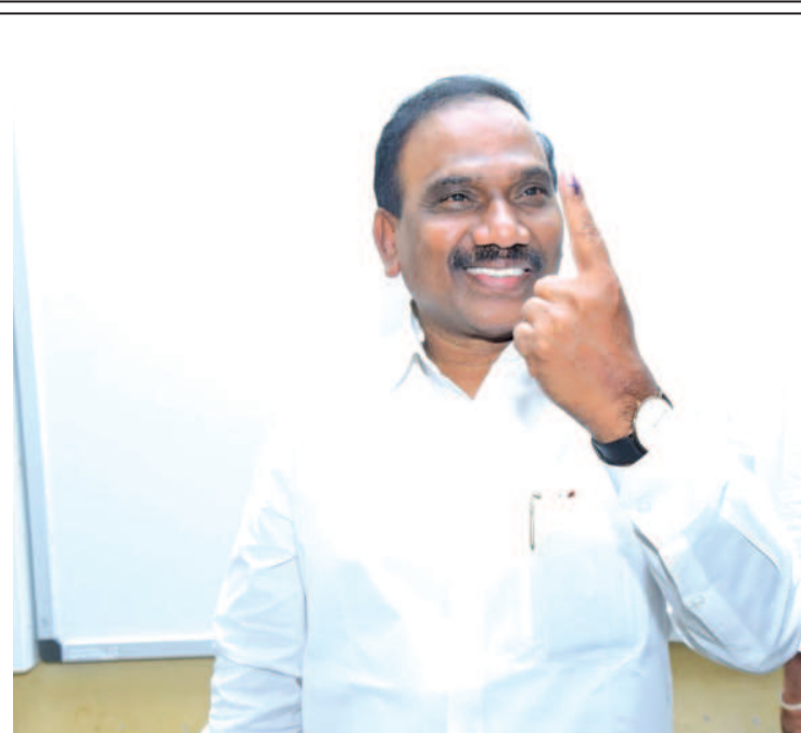
கழக துணைப் பொதுச் செயலாளர் ஆ.இராசா எம்.பி., அவர்கள் பெரம்பலூர் மாவட்டத்திலுள்ள தமது சொந்த கிராமமான வேலூரில் உள்ள உயர்நிலைப் பள்ளியில் வாக்களித்தார்.