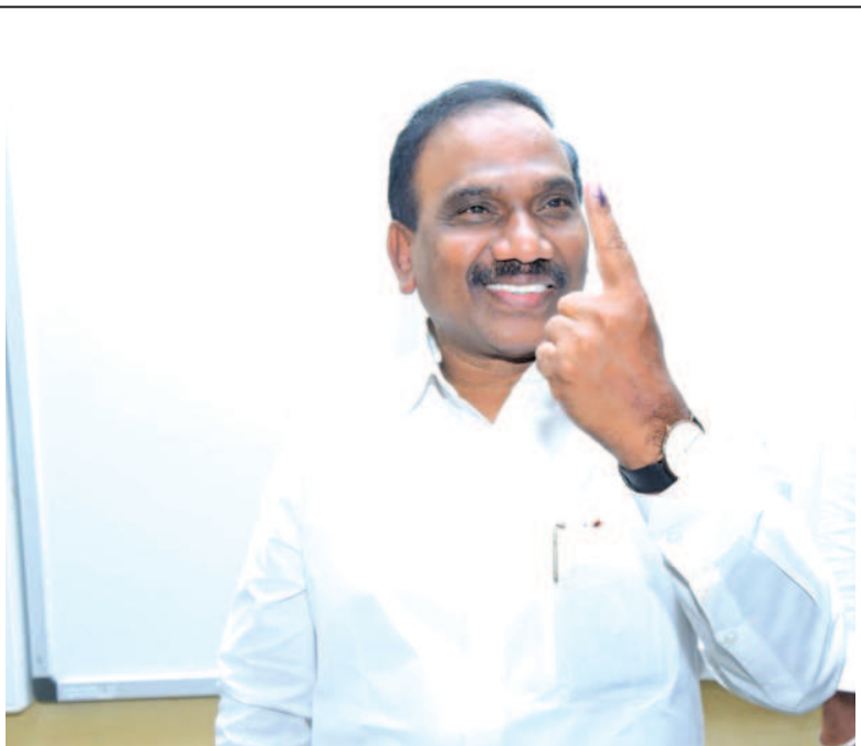
கழக துணைப் பொதுச் செயலாளர் ஆ.இராசா எம்.பி., அவர்கள் பெரம்பலூர் மாவட்டத்திலுள்ள தமது சொந்த கிராமமான வேலூரில் உள்ள உயர்நிலைப் பள்ளியில் வாக்களித்தார்.