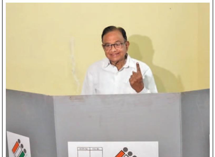
சிவகங்கை மாவட்டம் கண்டனூர் சிட்டாள் ஆச்சி பெண்கள் மேல்நிலைப் பள்ளியில் முன்னாள் ஒன்றிய நிதியமைச்சர் ப.சிதம்பரம் எம்.பி தனது வாக்கினை செலுத்தினார்.