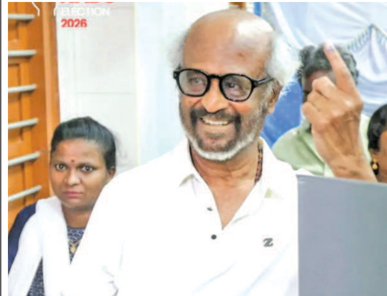
சென்னை எட்டெல்லா மேரிஸ் கல்லூரியில் கூப்பர் ஸ்டார் ரஜினிகாந்த் அவர்கள் தனது வாக்கினை பதிவு செய்தார்.