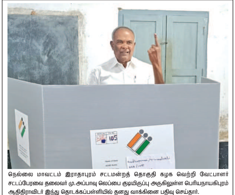
நெல்லை மாவட்டம் இராத்தாபுரம் சட்டமன்றத் தொகுதி கழக வெற்றி வேட்பாளர் சட்டப்பேரவை தலைவர் மு.அப்பாவு லெப்பை குழியிருப்பு அருகிலுள்ள பெரியநாயகிபுரம் ஆதிதிராவிடர் இந்து தொடக்கப்பள்ளியில் தனது வாக்கினை பதிவு செய்தார்.