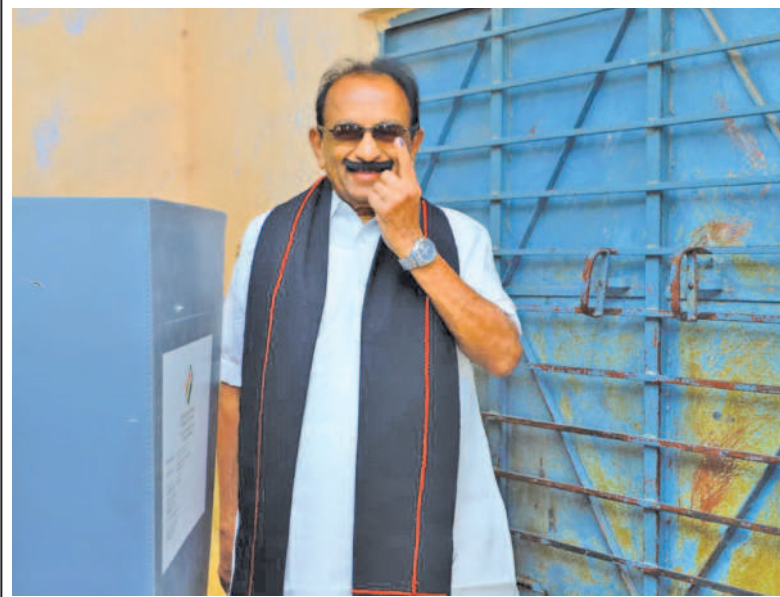
மறுமலர்ச்சி தி.மு.க. பொதுச்செயலாளர் வைகோ அவர்கள், தென்காசி மாவட்டம், திருவேங்கடம் வட்டம், கலிங்கப்பட்டியில் அமைந்துள்ள அரசு மேல்நிலைப்பள்ளி வாக்குச்சாவடியில் தனது வாக்கினை பதிவு செய்தார்.