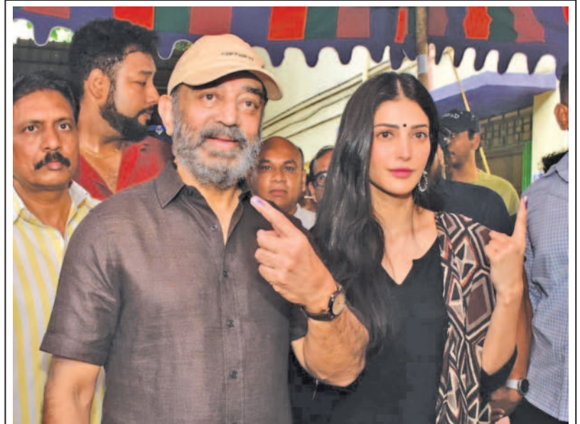
மக்கள் நீதி மய்யம் கட்சித்தலைவர் கமல் ஹாசன் எம்.பி. அவர்கள், தனது மகள் ஸ்ருதிஹாசனுடன் வந்து சென்னை எட்டாம்பல் ரோடு, திருவள்ளூர் சாலை சந்திப்பில் இருக்கும் சென்னை உயர்நிலைப்பள்ளியில், தன்னுடைய வாக்கை பதிவு செய்தார்.