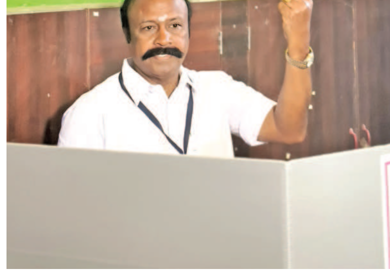
சிவகங்கை மாவட்டம் திருப்பத்தூர் சட்டமன்றத் தொகுதி அரளிக்கோட்டையில் வேட்பாளர் அமைச்சர் கே.ஆர்.பெரிய கருப்பன் வாக்களித்தார்