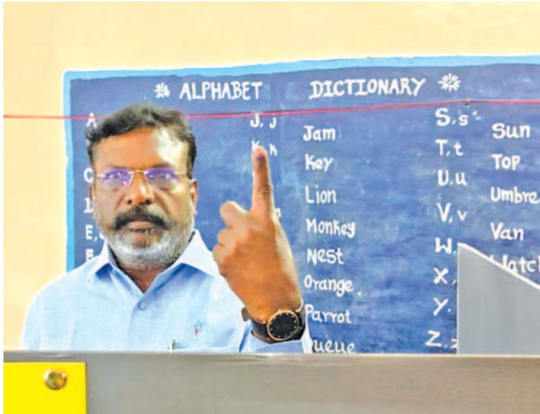
அரியலூர் மாவட்டம் செந்துறை ஒன்றியம் அங்கனூர் தமது சொந்த கிராமத்தில் உள்ள ஊராட்சி ஒன்றிய நடுநிலைப் பள்ளியில் அமைந்துள்ள வாக்குச்சாவடி மையத்தில் விடு தலை சிறுத்தைகள் கட்சி தலைவர் எழுச்சி தமிழர் தொல்.திருமாவளவன் வாக்களித்தார்.