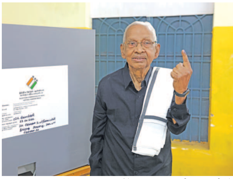
சென்னை அடையாறு காமராசர் அவென்யூவில் உள்ள அரசு உயர்நிலைப் பள்ளியில் அமைக்கப்பட்டிருந்த வாக்குச் சாவடியில் திராவிடர் கழகத் தலைவர் கி.வீரமணி அவர்கள் தனது குடும்பத்தாருடன் சென்று, வரிசையில் நின்று வாக்களித்தார்.