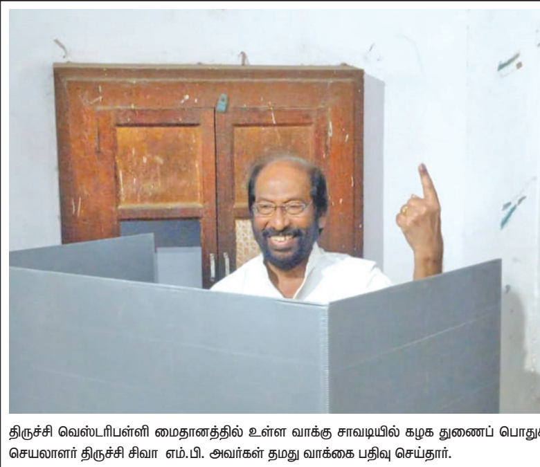
திருச்சி வெள்ளிப்பள்ளி மைதானத்தில் உள்ள வாக்கு சாவடியில் கழக துணைப் பொதுச் செயலாளர் திருச்சி சிவா எம்.பி. அவர்கள் தமது வாக்கை பதிவு செய்தார்.