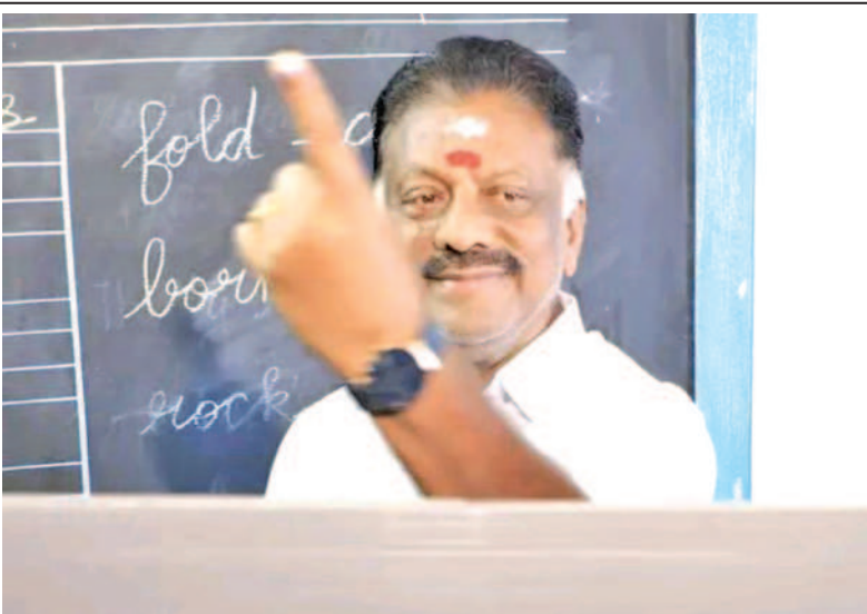
தேனி மாவட்டம் போடி தொகுதி கழக வேட்பாளர் முன்னாள் முதல்வர் ஓ.பன்னீர்செல்வம் பெரியகுளத்தில் உள்ள செவந்தே மெடிக் பள்ளியில் தனது வாக்கை செலுத்தினார்.