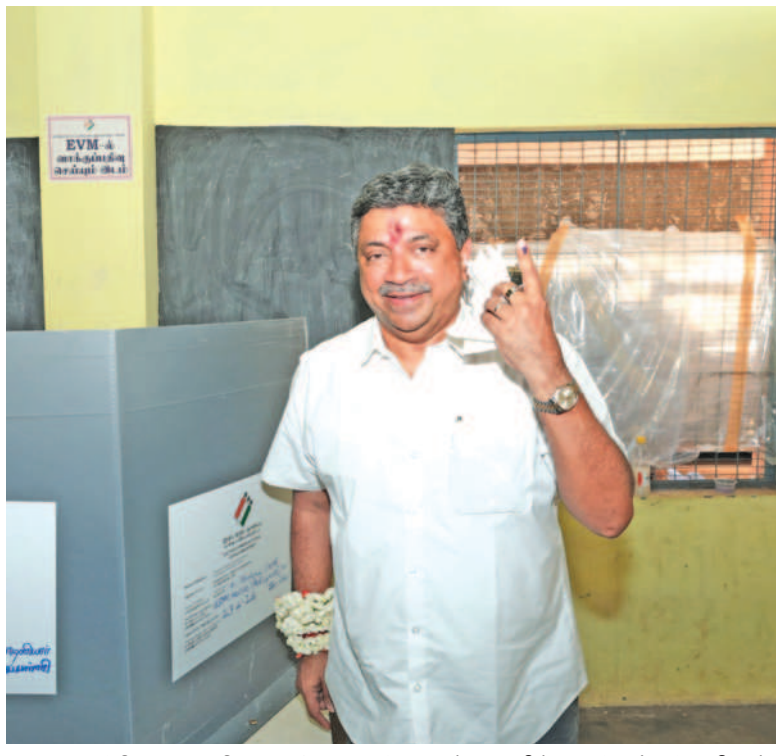
மதுரை மத்திய தொகுதி கழக வேட்பாளர் தகவல் தொழில்நுட்பம் மற்றும் டிஜிட்டல் சேவைகள் துறை அமைச்சர் பி.டி.ஆர். பழனிவேல் தியாகராஜன் தொகுதிக்குட்பட்ட மதுரை மாநகராட்சி காக்கைபாளையார் பெண்கள் மேல்நிலைப் பள்ளியில் தமது வாக்கினை பதிவு செய்தார்