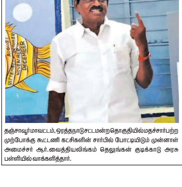
தஞ்சாவூர் மாவட்டம், ஓரத்தநாடு சட்டமன்ற தொகுதியில் மதச்சார்பற்ற முற்போக்கு கூட்டணி கட்சிகளின் சார்பில் போட்டியிடும் முன்னாள் அமைச்சர் ஆர்.வைத்தியலிங்கம் தெலுங்கன் குடிக்காடு அரசு பள்ளியில் வாக்களித்தார்.