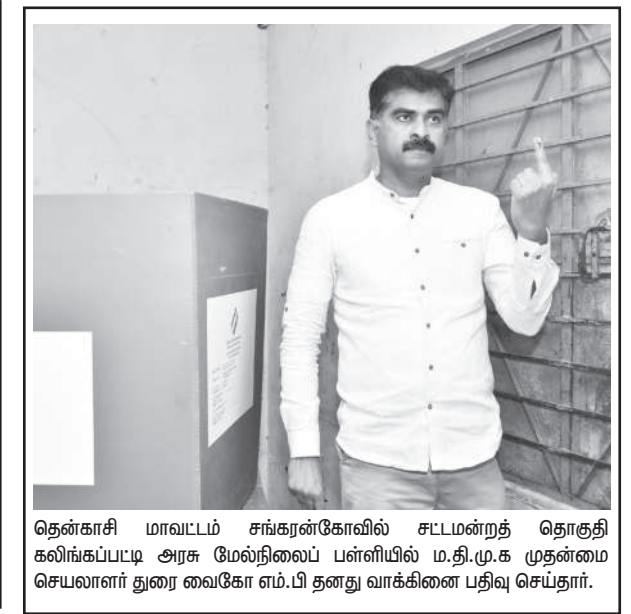
தென்காசி மாவட்டம் சங்கரன்கோவில் சட்டமன்றத் தொகுதி கவிக்கப்படி அரசு மேல்நிலைப் பள்ளியில் ம.தி.மு.க முன்னமை செயலாளர் துரை வைகோ எம்.பி தனது வாக்கினை பதிவு செய்தார்.