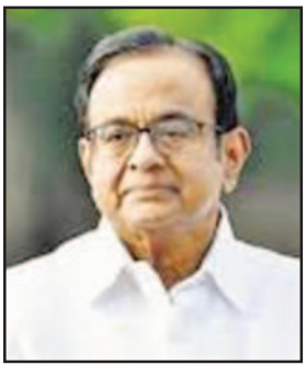
யான அரசு வேண்டும். வளர்ச்சி வேண்டும். மக்கள்

காரைக்குடி, ஏப்.25- சிவகங்கை மாவட்டம், காரைக்குடி அருகே கண்டனூரில் உள்ள சிட்டபாளையம் ஆச்சி பள்ளி வாக்குச்சாலை மையத்தில் நேற்று முன்தினம் காலை முதல் நபராக முன்னாள் நிதி அமைச்சர் ப.சிதம்பரம் வாக்களித்தார். பின்னர், அவர் அளித்த பேட்டி வருமாறு:- தமிழ்நாட்டில் ஒரு நிலை