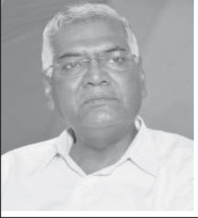
வாக்கை செலுத்தினார். பின்னர், செய்தியாளர்களிடம் அவர்கள் கூறிய தாவது: டி.ராஜா: நமது ஜனநாயகத்தை வலுப்படுத்த வாக்கு செலுத்துவது என்பது ஒரு முக்கியமான உரிமையாகும். இந்த தேர்தலில் தி.மு.க. தலைமையிலான கூட்டணி வெற்றி பெற்று ஆட்சி அமைக்கும். அதே போல், மேற்கு வங்கத்தில் டி.மு.க. தேற்கழகக் கப்பல வேண்டும். தமது தமிழகம் பா.ஜ.க. வின்