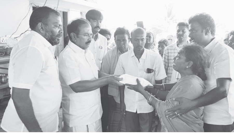
அடைந்தார். இவரது மரணம் குறித்து தகவல் அறிந்த