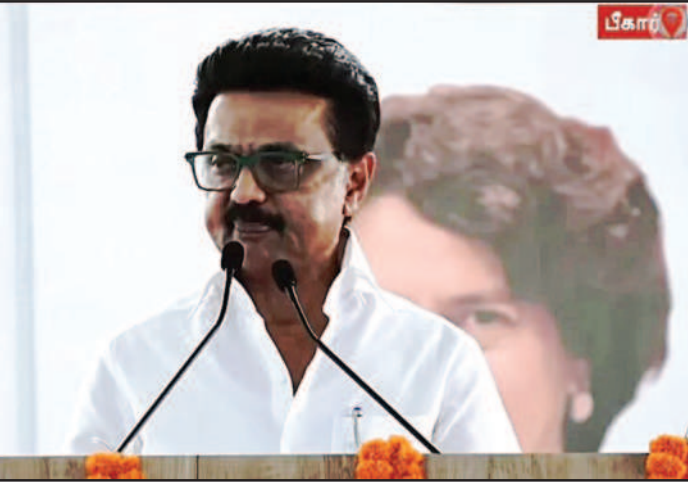
முடிந்தபிறகு, புதிய மக்கள் தொகைக்கு ஏற்றாற்போல நாடாளுமன்ற தொகுதிகளை அதிகரித்து மறுவரையறை செய்யலாம் என்று கூறுகிறது.

இந்த விவாதத்தை முடித்து வைக்கும் விதமாக வந்தது தான் தொகுதி மறுவரையறை சட்டம். அதனைச் சுருக்கமாக புரிந்துகொள்வோம். அரசியலமைப்பு சட்டம், பத்தாண்டுகளுக்கு ஒருமுறை மக்கள் தொகை கணக்கெடுப்பு நடந்து