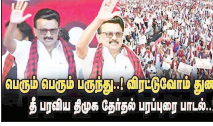
பெரும் பெரும் பருந்து..! விரட்டுவோம் துணிஞ்சு..! தீ பரவிய திமுக தேர்தல் பரப்புரை பாடல்..!

இந்த பின்னணியில் தான் பா.ஜ.க. திடீரென சென்றவாரம் மூன்று புதிய மசோதாக்களை அறிமுகம் செய்ய நாடாளுமன்றத்தைக் கூட்டியது. அதில் டீலிவிடேஷன் கமிட்டியை அறிவிப்பது, மொத்த தொகுதிகளை 850 என்று