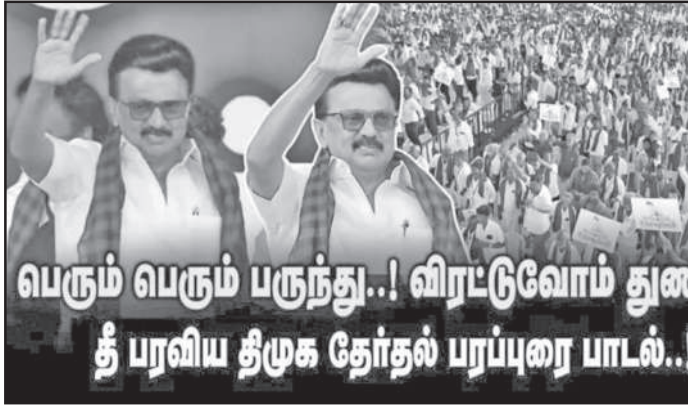
வரும் வரும் பருந்து..! விரட்டுவோம் துணிஞ்சு..! தீ பரவிய திமுக தேர்தல் பரப்புரை பாடல்..!

இந்த பின்னணியில் தான் பா.ஜ.க. திடீரென சென்றவாரம் மூன்று புதிய மசோதாக்களை அறிமுகம் செய்ய நாடாளுமன்றத்தைக் கூட்டியது. அதில் டிபிலிடிடெஷன் கமிட்டியை அறிவிப்பது, மொத்த தொகுதிகளை 850 என்று