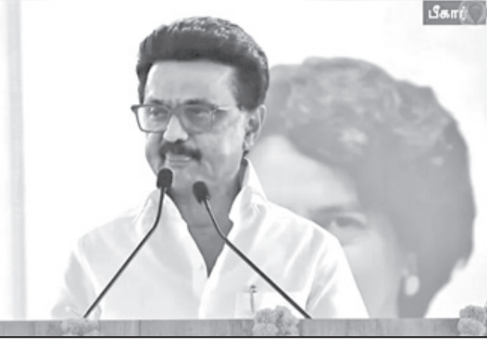
முடிந்தபிறகு, புதிய மக்கள் தொகைக்கு ஏற்றாற்போல நாடாளுமன்ற தொகுதிகளை அதிகரித்து மறுவரையறை செய்யலாம் என்று கூறுகிறது.

இந்த விவாதத்தை முடித்து வைக்கும் விதமாக வந்தது தான் தொகுதி மறுவரையறை சட்டம். அதனைச் சுருக்கமாக புரிந்துகொள்வோம். அரசியலமைப்பு சட்டம், பத்தாண்டுகளுக்கு ஒருமுறை மக்கள் தொகை கணக்கெடுப்பு நடந்து