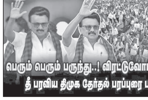
பெரும் பெரும் பருந்து..! விரட்டுவோம் துணிஞ்சு..! தீ பரவிய திமுக தேர்தல் பரப்புரை பாடல்..!

இவை அனைத்தையுமே பெண்களுக்கான இட ஒதுக்கீட்டிற்கான மசோதாக்கள் என்று பா.ஜ.க. கூறியதுதான் மிகப்பெரிய மோசடி எனலாம். பெரும் பருந்து வரும் ஒளிஞ்சு என்ற வார்த்தைகளுக்கு ஏற்ப மகனார் நலன் என்ற போர்வையில் இந்த அரசியல் கட்டுமானத்தையே மாற்றியமைக்க பா.ஜ.க. முயன்றது. பொங்கியெழுந்த முதல்வர் ஸ்டாலின் மிக்க கடுமையாக ஒன்றிய அரசை எச்சரித்தார். தமிழ்நாடு முழுவதும் அனைத்து இல்லங்களிலும் கருப்புக் கொடி ஏற்றச் சொன்னார். கருப்புச் சூடை அணியச் சொன்னார். அவரே கருப்புக் கொடியேற்றி, மசோதாவின் நகலை எரித்தார். இது மிகப்பெரிய எழுச்சியை உருவாக்கியது.