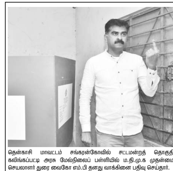
தென்காசி மாவட்டம் சங்கரன்கோவில் சட்டமன்றத் தொகுதி கலிங்கப்படி அரசு மேல்நிலைப் பள்ளியில் ம.தி.மு.க முன்னமை செயலாளர் துரை வைகோ எம்.பி தனது வாக்கினை பதிவு செய்தார்.