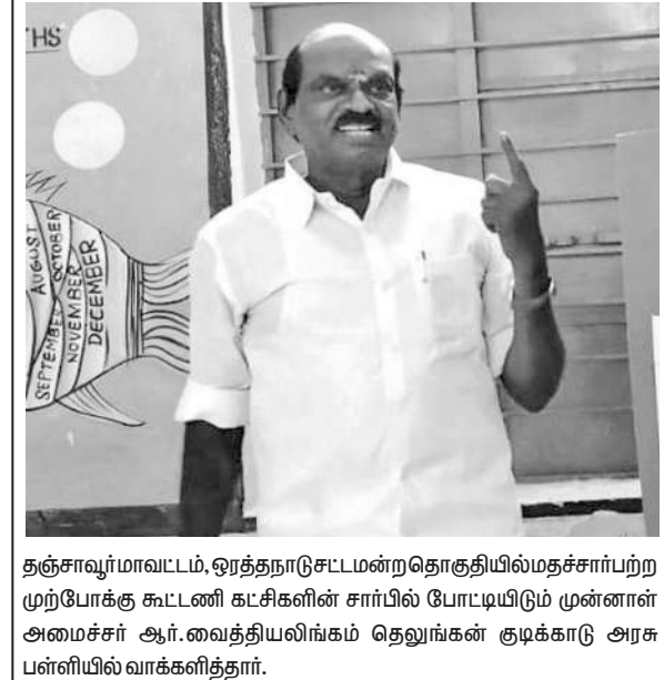
தஞ்சாவூர் மாவட்டம், ஓரத்தநாடு சட்டமன்ற தொகுதியில் மதச்சார்பற்ற முற்போக்கு கூட்டணி கட்சிகளின் சார்பில் போட்டியிடும் முன்னாள் அமைச்சர் ஆர்.வைத்தியலிங்கம் தெலுங்கன் குடிக்காடு அரசு பள்ளியில் வாக்களித்தார்.