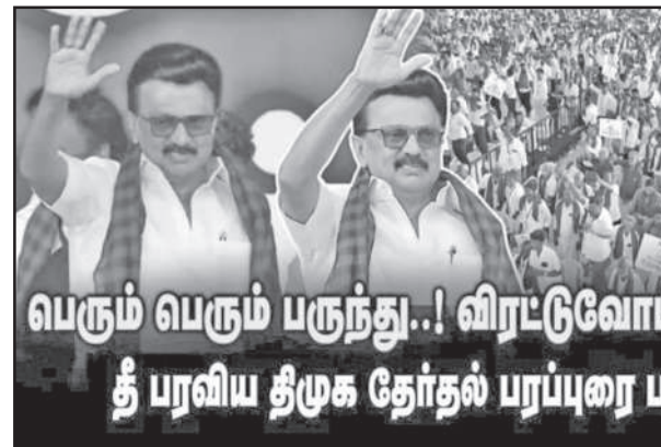
பெரும் பெரும் பருந்து..! விரட்டுவோம் துணிஞ்சு..! தீ பரவிய திமுக தேர்தல் பரப்புரை பாடல்..!

பொங்கியெழுந்த முதல்வர் ஸ்டாலின் மிக்க கடுமையாக ஒன்றிய அரசை எச்சரித்தார். தமிழ்நாடு முழுவதும் அனைத்து இல்லங்களிலும் கருப்புக் கொடி ஏற்றச் சொன்னார். கருப்புச் சூடை அணியச் சொன்னார். அவரே கருப்புக் கொடியேற்றி, மசோதாவின் நகலை எரித்தார். இது மிகப்பெரிய எழுச்சியை உருவாக்கியது.