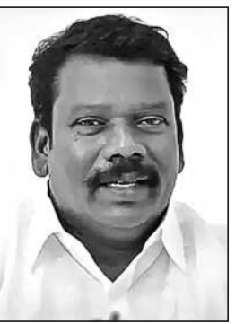
விடியோ மற்றும் புகைப்பட ஆதாரங்களையும் அவர் வெளியிட்டார்.

தவில்லை என வருமான வரித்துறை கூறுவது அப்பட்டமான பொய் என்று கண்டனம் தெரிவித்தார். மேலும், வருமான வரித் துறை சோதனை தற்போது சோதனை நடத்தப்படாததற்கான காரணம் தலைவர் செல்வம் பெருந்தகை பேட்டி.