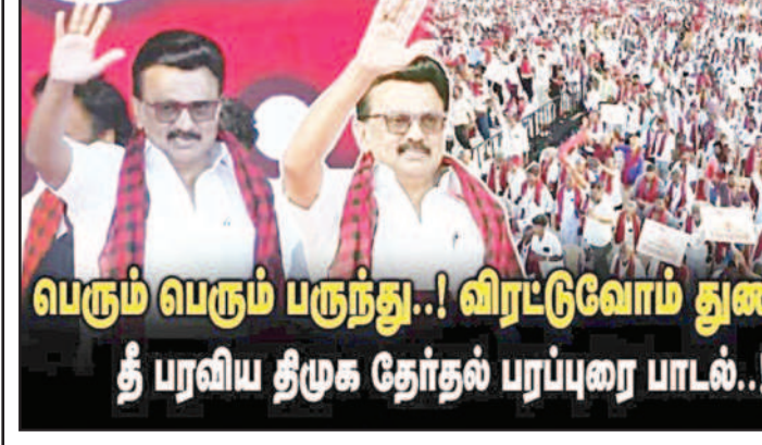
பெரும் பெரும் பருந்து..! விரட்டுவோம் துணிஞ்சு..! தீ பரவிய திமுக தேர்தல் பரப்புரை பாடல்..!

இவை அனைத்தையுமே பெண்களுக்கான இட ஒதுக்கீட்டிற்கான மசோதாக்கள் என்று பா.ஜ.க. கூறியதுதான் மிகப்பெரிய மோசடி எனலாம். பெரும் பருந்து வரும் ஒளிஞ்சு என்ற வார்த்தைகளுக்கு ஏற்ப மகனார் நலன் என்ற போர்வையில் இந்திய அரசியல் கட்டுமானத்தையே மாற்றியமைக்க பா.ஜ.க. முயன்றது.