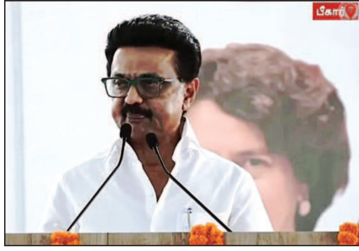
சிக்ஸர் இணைந்து நின்ற இந்த மசோதாக்களை முறி யடித்தன. மூன்றில் இரண்டு பங்கு ஆதரவு இல்லாத தால் மசோதாக்கள் தோல்வி அடைந்தன.

தமிழ்நாட்டு தேர்தல் வரலாற்றில் நீச்சயம் வித்தியாசமான தேர்தல்தான் இது. காரணம் இந்த தேர்தலில் போட்டியாருக்கும், யாருக்கும் இடையில் என்பதிலேயே அனைத்து தரப்பினருக்கும் உடன்பாடு இருக்கவில்லை. தமிழ்நாட்டின் ஆளுகட்சியான தி.மு.க. இந்த தேர்தல் "உடல்வி அணிக்கும், தமிழ்நாடு அணிக்கமான போட்டி" என்று அறிவித்தே தேர்தலை சந்திக்கிறது. எதிர்க்கட்சியான அ.இ.அ.தி.மு.க. இந்த நோக்கினை மறுத்து, இந்த தேர்தலும் வழமையான தமிழ்நாட்டு முரணரசியலான "தி.மு.க. எதிர் அ.இ.அ.தி.மு.க." என்ற போட்டிதான் என்று கூறுகிறது. இந்த இரண்டிலிருந்தும் மாறுபட்டு புதிதாகக் கட்சி துவங்கியுள்ள நடிகர் விஜய் "தி.மு.க. எதிர் தலைவ" என்பதுதான் போட்டி என்று ஓயாமல் ஒவ்வொரு கூட்டத்திலும் அரற்றத் தொடங்கினார்.