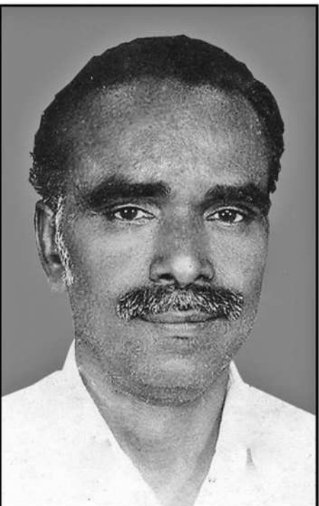
தலைமைக் கழகம் தி.மு.க.

நாகை மாவட்டம், சிக்கல் கிளைச் செயலாளர், மூன்று முறை ஒன்றியச் செயலாளர், தலைமைச் செயற்குழு, பொதுக்குழு ஆகிய பொறுப்புகளில் பணியாற்றியவர்.