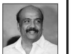
மருது அழகுராஜ் கழகச் செய்தித் தொடர்புக் குழு துணைத் தலைவர்