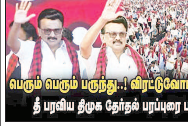
பெரும் பெரும் பருந்து..! விரட்டுவோம் துணிஞ்சு..! தீ பரவிய திமுக தேர்தல் பரப்புரை பாடல்..!

இந்த விவாதத்தை முடித்து வைக்கும் விதமாக வந்தது தான் தொகுதி மறுவரையறை சட்டம். அதனைச் சுருக்கமாக புரிந்துகொள்வோம். அரசியலமைப்பு சட்டம், பத்தாண்டுகளுக்கு ஒருமுறை மக்கள் தொகை கணக்கெடுப்பு நடந்து