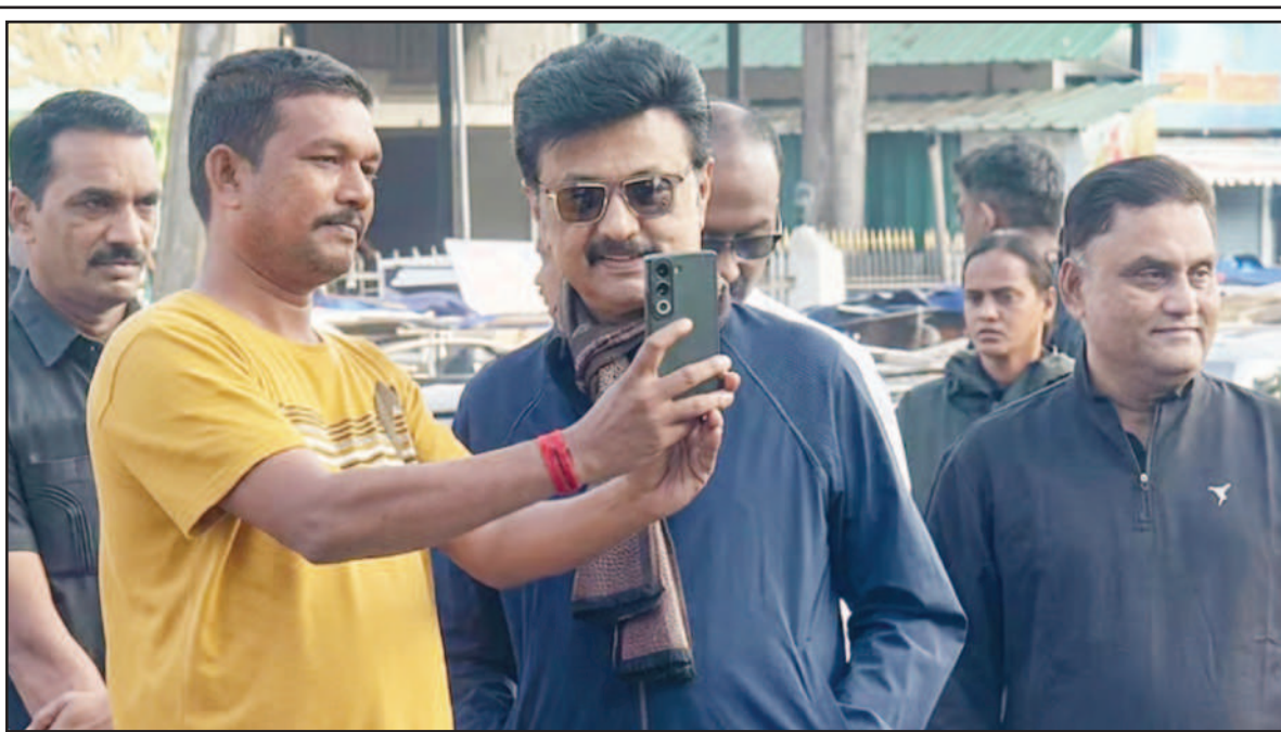
முதல்வர் மு.க.ஸ்டாலின் அவர்கள் கொடைக்கானலில் நேற்று (26.04.2026) நடைபயிற்சி மேற்கொண்டபோது, பொதுமக்கள் செல்ஃபி எடுத்து மகிழ்ந்தனர்!

கொடைக்கானல், ஏப். 27 - கொடைக்கானலில் நடைபயிற்சி மேற்கொண்ட முதல்வர் மு.க.ஸ்டாலின் அவர்களுடன், ஏராளமான பொது மக்களும் சுற்றுலாப் பயணிகளும் செல்ஃபி எடுத்துக்கொண்டும், கை குலுக்கியும் வாழ்த்துத் தெரிவித்தனர். சட்டப்பேரவைத் தேர்தல் கடந்த 23ம் தேதி முடிவடைந்தது. வாக்கு எண்ணிக்கை மே 4ம் தேதி நடைபெற உள்ளது. தேர்தலையொட்டி, முதலமைச்சரும் - தி.மு.க. தலைவருமான மு.க.ஸ்டாலின் அவர்கள் கடந்த ஒரு மாதத்துக்கும் மேலாக பல்வேறு மாவட்டங்களுக்கும் தொடர்ச்சியாக சுற்றுப்பயணம் மேற்கொண்டு, மதச்சார்பற்ற முற்போக்குக் கூட்டணி வேட்பாளர்களுக்குத் தீவிர பிரச்சாரம் மேற்கொண்டார்.