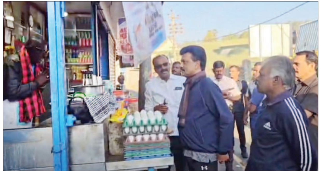
முதல்வர் மு.க.ஸ்டாலின் அவர்கள், கொடைக்கானலில் நேற்று நடைபயிற்சி மேற்கொண்டபோது பொதுமக்கள் சந்தித்து மகிழ்ச்சியுடன் கை குலுக்கி வாழ்த்துத் தெரிவித்தனர்!