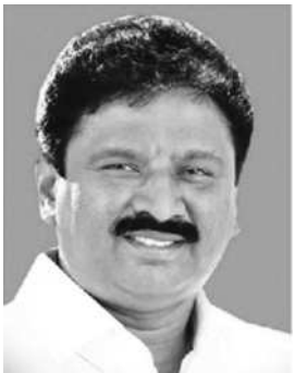
அனைத்துக் கட்சி நிர்வாகிகளுக்கும், தொண்டர்களுக்கும், எல்லா வகையிலும் உறுதுணையாக நின்ற கழக உடன்பிறப்புகளுக்கும்,