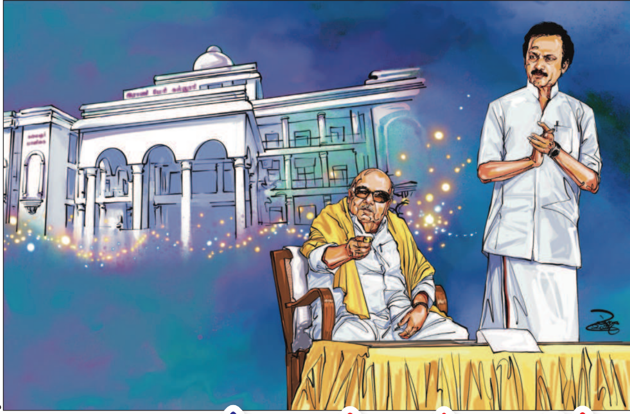
ஒலியம் : ரவி பேலட்

1958-இல் பெங்களூருவில் உள்ள சுபாஷ் நகரில், தி.மு.க. சார்பில் மாநாடு ஒன்று நடைபெற்றது. கண்ட இலக்கியவாதியான டி.பி.கைவாசத்தின் பெயர் மாநாட்டுப் பந்தலுக்குக் குட்டப்பட்டது. அன்றைக்கு மைசூரு மாநிலமாக இருந்த இதன் பெயரை, 'கர்நாடகம்' என மாற்றக்கோரி அந்த மாநாட்டில் தீர்மானம் நிறைவேற்றப் பட்டது. 'தமிழகத்தில் மட்டுமன்றி, மைசூரு மாநிலத்திலும் தி.மு.க. வேகமாக வளர்ந்துவருகிறது. வட இந்தியர்கள், இந்த வளர்ச்சியைக் கண்பூடி கவனிக்கலாம் இருந்துவிடக் கூடாது' என மும்பையில் இருந்து வெளிவந்த 'கரன்ட்' ஏடு செய்தி வெளியிட்டது.