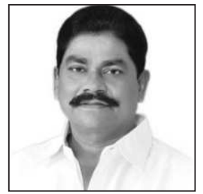
தி.மு.க. சார்பில் வானியம் பாடி, ஆம்பூர், ஜோலார் பேட்டை மற்றும் திருப்பத்தூர் சட்டமன்றத் தொகுதிகளில் வாக்கு எண்ணும் முகவர்களுக்கான ஆலோசனைக் கூட்டம் உள்ள மாவட்ட கழக அலுவலகத்தில் 25.2026 சனிக்கிழமை மாலை 4.00 மணியளவில் நடைபெறுகிறது. இக்கூட்டத்தில் நாடாளுமன்ற உறுப்பினர்கள், மதச்சார்பற்ற முற்போக்கு கூட்டணி வேட்பாளர்கள், மாவட்ட கழக நிர்வாகிகள், தலைமைச் செயற்குழு, பொதுக்குழு உறுப்பினர்கள், நகர, ஒன்றிய,