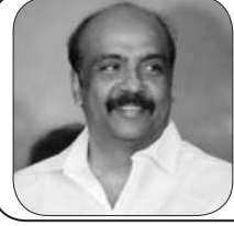
மருது அழகராஜ் கழகச் செய்தித் தொடர்புக் குழு துணைத் தலைவர்