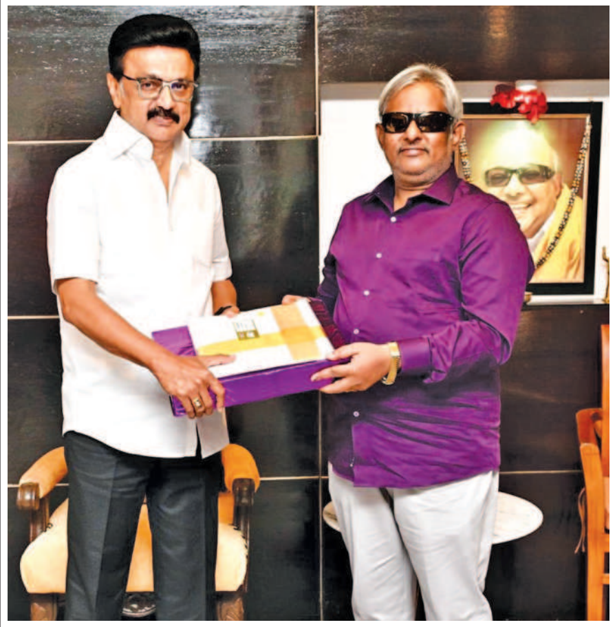
முதலமைச்சர் மு.க.ஸ்டாலின் அவர்களை அவரது இல்லத்தில் புகைப்பட நிபுணர் கோவை சுப்பு தமது 61வது ஆண்டு பிறந்தநாளையொட்டி சந்தித்து வாழ்த்தும் பெற்றார்!