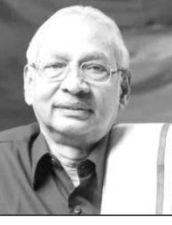
சென்னை, மே 4 - புவி வெப்பமயமாதல், இயற்கைப் பேரிடர்களிலிருந்து மனித குலத்தைக் காக்க நிரந்தரத் தீர்வுகளை நோக்கிச் செயல்படவேண்டும்!

சென்னை, மே 4 - புவி வெப்பமயமாதல், இயற்கைப் பேரிடர்களிலிருந்து மனித குலத்தைக் காக்க நிரந்தரத் தீர்வுகளை நோக்கிச் செயல்படவேண்டும்! சுற்றுச்சூழல் பாதுகாப்பை முன்னிறுத்தி, மக்கள் இயக்கம் - தீவிரப் பிரச்சாரத் திட்டங்கள்! "சுற்றுச்சூழல் காப்பது பிறருக்காக அல்ல; நமக்காக! என்று திராவிடர் கழகத் தலைவர் கி.வீரமணி அவர்கள் அறிக்கை விடுத்ததுள்ளார்.