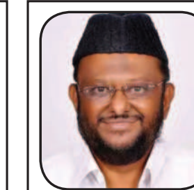
ஜவாஹிருல்லா ம.ம.க. (நாகப்பட்டினம்)