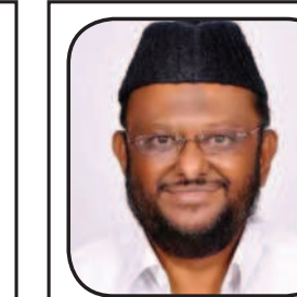
ஜவாஹிருல்லா ம.ம.க. (நாகப்பட்டினம்)