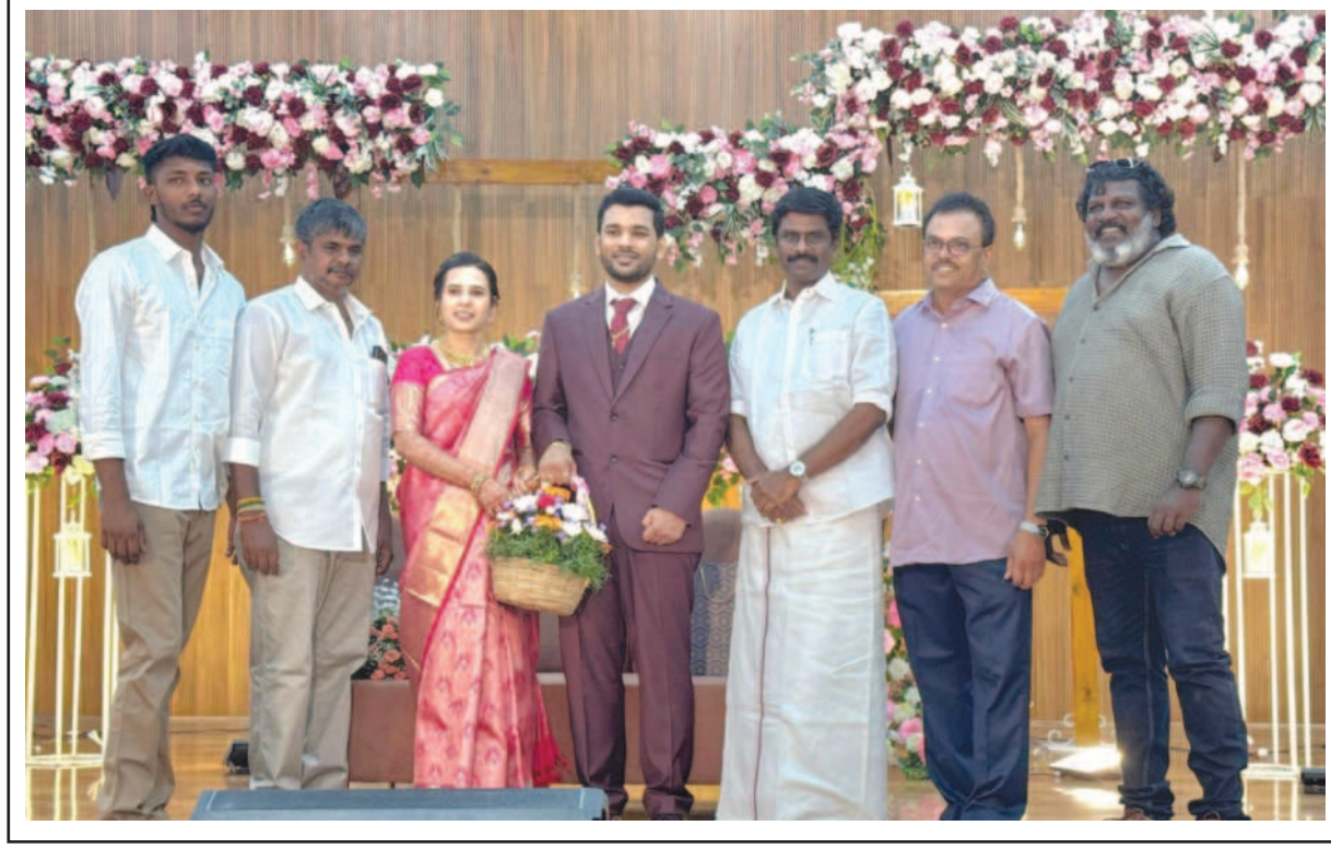
பண்பாட்டும் படையெடுப்பின் தொடக்கமா? முதலமைச்சர் பதவி ஏற்பு விழாவில்