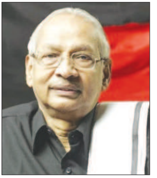
அதைவிட, 'வெந்த புண்ணில் வேல் பாச்சுவதைப் போல', நம் மொழி செம்மொழித் தமிழ் வாழ்த்தாம் "நீராரும் கடவுளுக்கு" நம் தொடராத இடுக்க வழிவகை காணவேண்டும்!

சென்னை, மே 12- திராவிடர் கழகத் தலைவர் கி.வீரமணி அவர்கள் விடுத்துள்ள கண்டன அறிக்கையில், முதலமைச்சர் பதவி ஏற்பு விழாவில் தமிழ்த்தாய் வாழ்த்து மூன்றாம் இடத்துக்குத் தள்ளுவதா? என்று தெரிவித்துள்ளார். அவரது அறிக்கை வருமாறு: முதலமைச்சர் ஜோசப் விஜய் அவர்களது பதவி ஏற்பு விழாவில், இதற்கு முன் எப்போதும் நடந்திராத "திடீர் மாற்றம்" - விழாவின் தொடக்கத்திலேயே நடைபெற்றதோடு, விழா முடிவிலும் அதைக் காண முடிந்தது. தமிழ்நாட்டின் பீடீய மீண்டும் ஹிந்தி, சமஸ்கிருத ஆர்.எஸ்.எஸ். கொள்கைப் பண்பாட்டின் ஆதிக்கம் தொடங்கி உள்ளது. நமது கண்டனத்தைப் பதிவு செய்யவேண்டியது அவசியம்! தமிழ்நாட்டின் புதிய அரசுக்கு, குறிப்பாக முதலமைச்சர் ஜோசப் விஜய் அவர்களுக்கு சுட்டிக்காட்டி (அதுவும் பதவியேற்ற அன்றே) நமது கண்டனத்தைப் பதிவு செய்ய வேண்டிய அவசியம் ஏற்பட்டுள்ளது. "வந்தே மாதரம்" பாடல் சமஸ்கிருத, ஹிந்தி மொழிப் படையெடுப்பின் படையெடுப்பு ஆகும். (சமஸ்கிருத மயப்படுத்தப்பட்ட