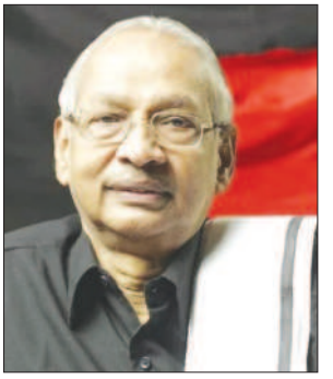
பார்த்து, தமிழ் உணர்வாளர்களின் நெஞ்சம் கொதிக்கிறது! இதுபோன்ற அலவங்க மீண்டும் தொடராதது இருக்க வழிவகை காண வேண்டும்! "மரபுகள் மாற்றப்பட்ட துதானா இவர்களால் சொல்லப்பட்ட மாற்றம்?" என்ற கேள்வி, தமிழ்நாட்டுக்கும் ஒலிக்கத் தொடங்கிவிட்டது. இது எப்படி? ஏன்? ஏற்பட்டது என்பதை முதலமைச்சர் ஓர் அவசர விசாரணை நடத்தி, அது போன்ற அலவங்க மீண்டும் தொடராதது இருக்க வழிவகை காணவேண்டும்!

சென்னை, மே 12- திராவிடர் கழகத் தலைவர் கி.வீரமணி அவர்கள் விடுத்துள்ள கண்டன அறிக்கையில், முதலமைச்சர் பதவி ஏற்பு விழாவில் தமிழ்த்தாய் வாழ்த்து மூன்றாம் இடத்துக்குத் தள்ளுவதா? என்று தெரிவித்துள்ளார். அவரது அறிக்கை வருமாறு: முதலமைச்சர் ஜோசப் விஜய் அவர்களது பதவி ஏற்பு விழாவில், இதற்கு முன் எப்போதும் நடந்திராத "திடீர் மாற்றம்" - விழாவின் தொடக்கத்திலேயே நடைபெற்றதோடு, விழா முடிவிலும் அதைக் காண முடிந்தது. தமிழ்நாட்டின் மீண்டும் ஹிந்தி, சமஸ்கிருத ஆர்.எஸ்.எஸ். கொள்கைப் பண்பாட்டின் ஆதிக்கம் தொடங்கி உள்ளது. நமது கண்டனத்தைப் பதிவு செய்யவேண்டியது அவசியம்! தமிழ்நாட்டின் புதிய அரசுக்கு, குறிப்பாக முதலமைச்சர் ஜோசப் விஜய் அவர்களுக்குக் கூட்டிக்காட்டி (அதுவும் பதவியேற்ற அன்றே) நமது கண்டனத்தைப் பதிவு செய்ய வேண்டிய அவசியம் ஏற்பட்டுள்ளது. "வந்தே மாதரம்" பாடல் சமஸ்கிருத, ஹிந்தி மொழிப் படையெடுப்பின் படையெடுப்பு ஆகும். (சமஸ்கிருத மயப்படுத்தப்பட்ட