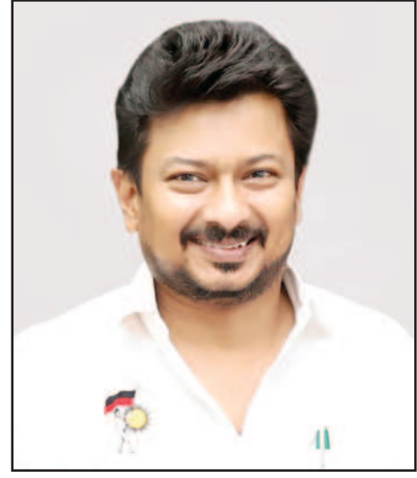
17வது சட்டமன்றப் பேரவையின் எதிர்க்கட்சித் தலைவராக எனது முதல் உரை இது.

சென்னை, மே 13 - "பேரறிஞர் அண்ணா அவர்கள் வழியில் தி.மு.க. ஆக்கப்பூர்வமான எதிர்க்கட்சியாகச் செயல்படும்" என்றும், "தமிழ்நாட்டின் உரிமைகளுக்காக - வளர்ச்சிக்காக இணைந்தே பயணிப்போம்" என்றும் சட்டப் பேரவைத் தலைவர் அவர்களை வாழ்த்தி உரையாற்றுகையில் எதிர்க்கட்சித் தலைவர் உதயநிதி ஸ்டாலின் அவர்கள் குறிப்பிட்டார். புதிதாகத் தேர்ந்தெடுக்கப்பட்ட சபாநாயகர் மற்றும் துணை சபாநாயகரை வாழ்த்தி, சட்டப்பேரவையில் எதிர்க்கட்சித் தலைவர் உதயநிதி ஸ்டாலின் அவர்கள் ஆற்றிய உரை வருமாறு :- பேரவைத் தலைவர் அவர்களே! துணைத் தலைவர் அவர்களே! முதலமைச்சர் அவர்களே!