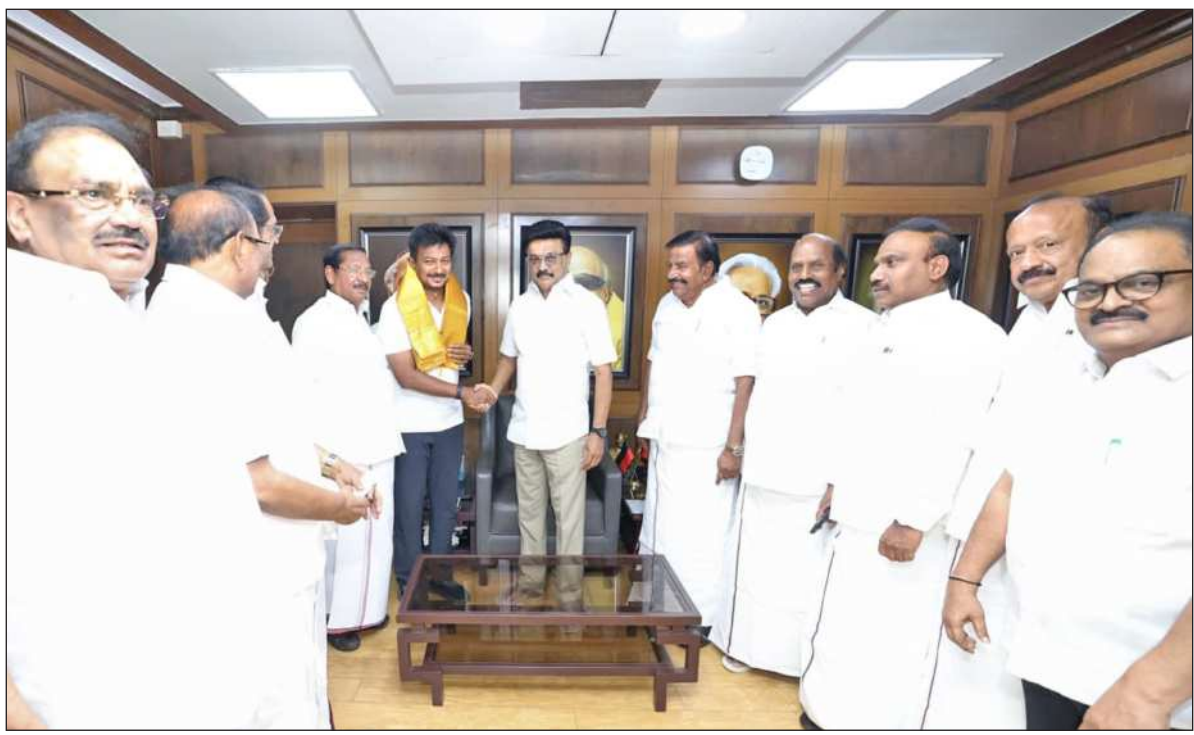
சென்னை - அண்ணா அறிவாலயத்தில், கழகத் தலைவர் மு.க.ஸ்டாலின் அவர்களை சட்டமன்ற எதிர்க்கட்சித் தலைவர் உதயநிதி ஸ்டாலின் அவர்கள் சந்தித்து வாழ்த்தும் பெற்றார். உடன் முன்னாள் அமைச்சர்கள், சட்டமன்ற - நாடாளுமன்ற முன்னாள், இந்நாள் உறுப்பினர்கள், தலைமைக் கழக நிர்வாகிகள் உள்ளனர்.