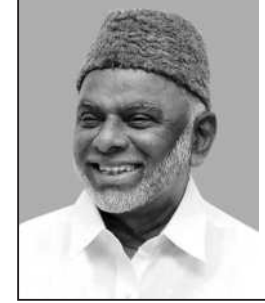
மக்களாட்சி மாத்திரமே நமக்காவதாக இருக்க முடியும் என்பதால் புதிய அரசு அமைந்திட நிபந்தனையற்ற ஆதரவை வழங்கியிருக்கிறோம். இதுதான் சாத்தியமாகும் என்ற நிலையில் மிக நீண்ட பரிசீலனைக்குப் பிறகு எங்கள் கட்சியின் அவசர உயர்மட்டக் குழு கூட்டம் கூடி அரசு அமைக்க ஆதரவு தருவதாக முடிவு எடுத்து அறிவித்தோம்.

திருச்சி, மே 13 - முந்தைய ஆட்சியில் நடைமுறைப்படுத்தப்பட்ட சிறப்பான மக்கள் நலத் திட்டங்களை தொடர்ச் செய்து அனைத்து தரப்பினரின் வரவேற்பையும் பாராட்டுக் களையும் பெறுகின்ற நல்லாட்சியைத் தரவேண்டும் என்பதே தமிழ்நாடு மக்களின் எதிர்பார்ப்பாகும் என்றும், தமிழ்நாடு முதலமைச்சராக ஜோசப் விஜய்வுக்கு இந்திய யூனியன் முஸ்லிம் லீக் வாழ்த்துதேசிய தலைவர் பேராசிரியர் கே.எம். காதர் மொகிதீன் வெளியிட்டுள்ள அறிக்கையில் கூறியிருப்பதாவது: