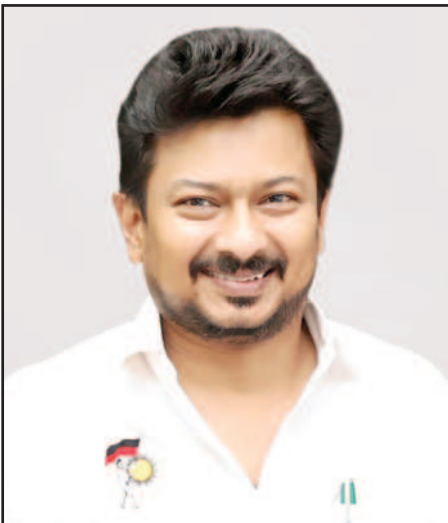
17வது சட்டமன்றப் பேரவையின் எதிர்க்கட்சித் தலைவராக எனது முதல் உரை இது.

பேரவைத் தலைவர் அவர்களே! துணைத் தலைவர் அவர்களே! முதலமைச்சர் அவர்களே!