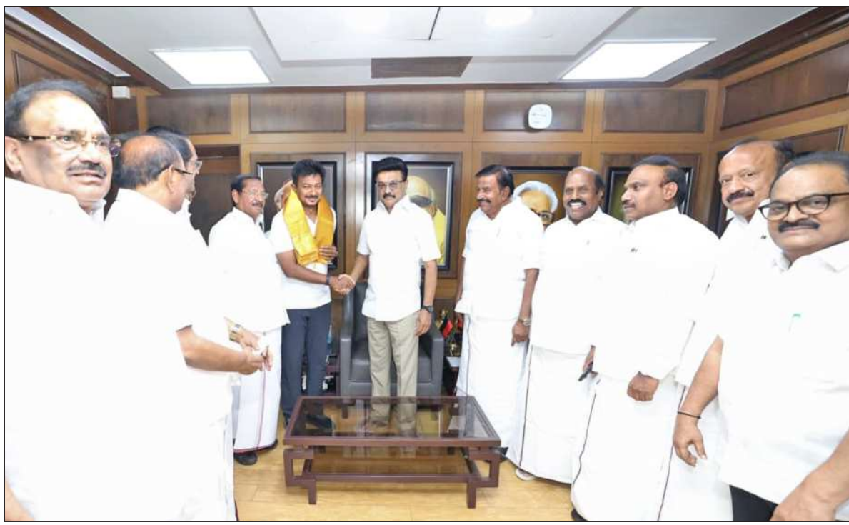
சென்னை - அண்ணா அறிவாலயத்தில், கழகத் தலைவர் மு.க.ஸ்டாலின் அவர்களை சட்டமன்ற எதிர்க்கட்சித் தலைவர் உதயநிதி ஸ்டாலின் அவர்கள் சந்தித்து வாழ்த்தும் பெற்றார். உடன் முன்னாள் அமைச்சர்கள், சட்டமன்ற - நாடாளுமன்ற முன்னாள், இந்நாள் உறுப்பினர்கள், தலைமைக் கழக நிர்வாகிகள் உள்ளனர்.