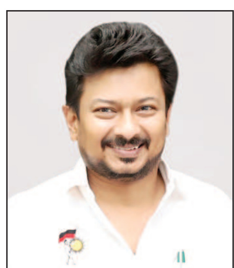
17வது சட்டமன்றப் பேரவையின் எதிர்க்கட்சித் தலைவராக எனது முதல் உரை இது.

சென்னை, மே 14 - "பேரறிஞர் அண்ணா அவர்கள் வழியில் தி.மு.க. ஆக்கப்பூர்வமான எதிர்க்கட்சியாகச் செயல்படும்" என்றும், "தமிழ்நாட்டின் உரிமைகளுக்காக - வளர்ச்சிக்காக இணைந்தே பயணிப்போம்" என்றும் சட்டப் பேரவைத் தலைவர் அவர்களை வாழ்த்தி உரையாற்றுகையில் எதிர்க்கட்சித் தலைவர் உதயநிதி ஸ்டாலின் அவர்கள் குறிப்பிட்டார். புதிதாகத் தேர்ந்தெடுக்கப்பட்ட சபாநாயகர் மற்றும் துணை சபாநாயகரை வாழ்த்தி, சட்டப்பேரவையில் எதிர்க்கட்சித் தலைவர் உதயநிதி ஸ்டாலின் அவர்கள் ஆற்றிய உரை வருமாறு :-