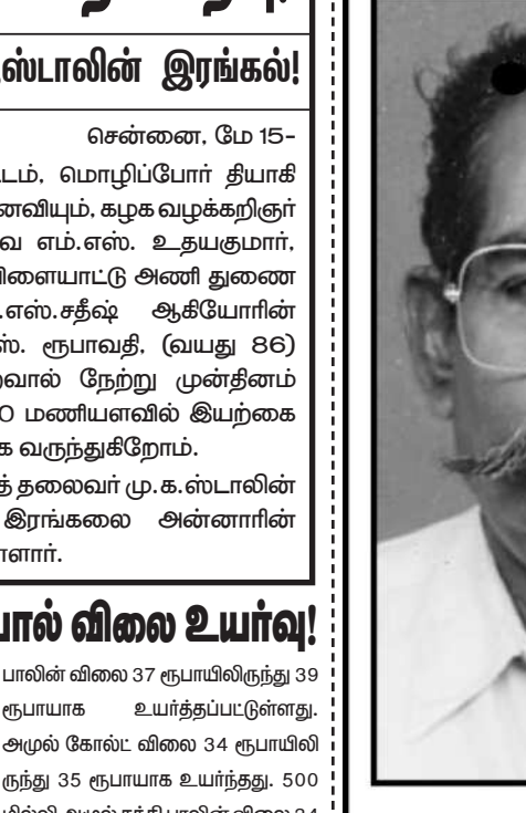
தலைமைக் கழகம் தி.மு.க.