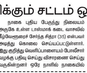
சிறப்பு அதிகாரியாக நியமித்தது ஏன்? எனவும்