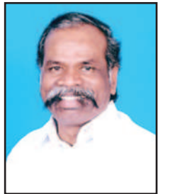
... கவிச்சுடர் கவிதைப்பித்தன்

பீடு மிகும்இளந் தமிழனடி!.. சட்டப் பேரவை எதிர்க்கட்சித் தலைவனடி! சூடும் தமிழ்நிலம் நாளையடி!.. இவன் தோள்களில் லே, புகழ் மூலையடி!