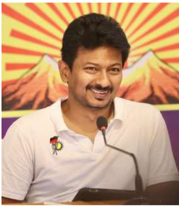
மக்களைப் பாதிப்புக்கு உள்ளாகும் வகையில் Petrol, Diesel, CNG விலையை ஒன்றிய அரசு உயர்த்தி

சென்னை, மே 17- பெட்ரோல், டீசல், சி.என்.ஜி. விலையை உயர்த்திய ஒன்றிய பா.ஜ.க. அரசுக்கு எதிர்க்கட்சித் தலைவர் உதயநிதி ஸ்டாலின் அவர்கள் கடும் கண்டனம் தெரிவித்துக் கொண்டுள்ளார். இது குறித்து அவர் வெளியிட்ட அறிக்கையில், மக்கள் மீதான இந்தச் சுமையை குறைக்க நடவடிக்கை எடுக்க வேண்டும் என வலியுறுத்தி உள்ளார். இது தொடர்பான அறிக்கையில் எதிர்க்கட்சித் தலைவர் உதயநிதி ஸ்டாலின் அவர்கள் குறிப்பிட்டுள்ளதாவது: ஏழை - எளிய - நடுத்தர வர்க்க