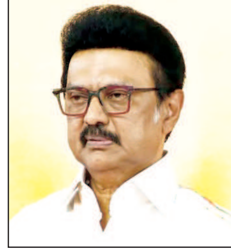
பாரத்தைப் போடுகிறது ஒன்றிய பா.ஜ.க. அரசு!

சென்னை, மே 17- ஒன்றிய பா.ஜ.க. அரசு பெட்ரோல், டீசல், சி.என்.ஜி. விலையை உயர்த்தியதற்கு கழகத் தலைவர் மு.க.ஸ்டாலின் அவர்கள் கண்டனம் தெரிவித்துள்ளார். இது குறித்து அவர் வெளியிட்டுள்ள கண்டன அறிக்கையில், இந்த விலை உயர்வால் சாமானிய மக்களின் வாழ்வாதாரமே கேள்விக்குறியாகப் போகிறது என்று குறிப்பிட்டுள்ளார். கழகத் தலைவர் மு.க.ஸ்டாலின் அவர்களின் அறிக்கை வருமாறு: மக்களின் தலையில் அடுத்தடுத்து