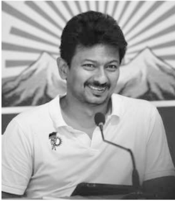
மக்களைப் பாதிப்புக்கு உள்ளாகும் வகையில் Petrol, Diesel, CNG விலையை ஒன்றிய அரசு உயர்த்தி

சென்னை, மே 17- பெட்ரோல், டீசல், சி.என்.ஜி. விலையை உயர்த்திய ஒன்றிய பா.ஜ.க. அரசுக்கு எதிர்க்கட்சித் தலைவர் உதயநிதி ஸ்டாலின் அவர்கள் கடும் கண்டனம் தெரிவித்துக் கொண்டுள்ளார். இது குறித்து அவர் வெளியிட்டிருள்ள அறிக்கையில், மக்கள் மீதான இந்தச் சுமையை குறைக்க நடவடிக்கை எடுக்க வேண்டும் என வலியுறுத்தி உள்ளார். இது தொடர்பான அறிக்கையை எதிர்க்கட்சித் தலைவர் உதயநிதி ஸ்டாலின் அவர்கள் குறிப்பிட்டுள்ளதாவது: ஏழை - எளிய - நடுத்தர வர்க்க