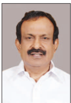
கட்கிழமை மாலை 4

ஈரோடு, மே 18 - ஈரோடு தெற்கு மாவட்டக் கழக செயலாளரும், முன்னாள் அமைச்சரும் மாணவர் சு.முத்துசாமி அறிக்கை வருமாறு: