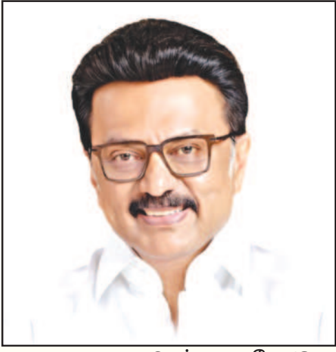
சென்னை, மே 18 -

கழகத் தலைவர் மு.க.ஸ்டாலின் 'டீவிட்டர்' பதிவில் பாராட்டு!