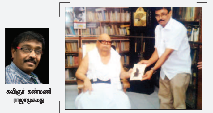
கவிஞர் கண்மணி ராஜாமுகமது