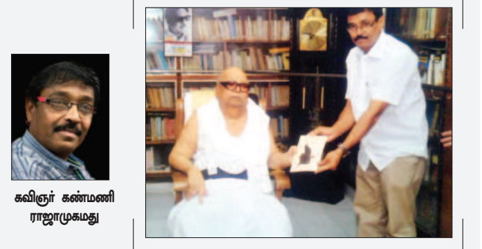
கவிஞர் கண்மணி ராஜாமுகமது