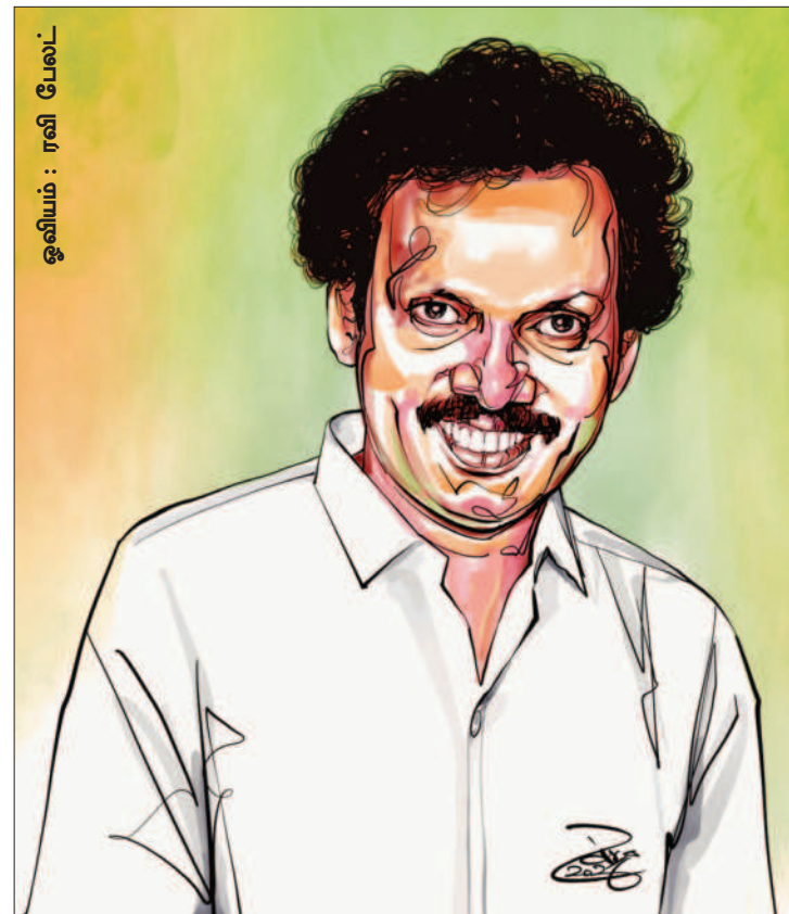
ஒலியம் : ரவி பேலட்

நூற்றுக்கணக்கான இளைஞர்களைக் கட்சியிலும் தனிப்பட்ட முறையிலும்