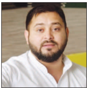
சரிந்து வருவது இது 8வது ஆண்டு என குறிப்பிட்டுள்ள தேஜஸ்வி. கடந்த 12 ஆண்டுகளில், ரூபாய் தனது மதிப்பில் பாதியை இழந்திருப்பதை சுட்டிக்காட்டியுள்ளார். நாட்டு மக்களை தவறாக வழி நடத்தும் பிரதமர், இந்தியா

பாடனா, மே 26 - மோடியின் நிர்வாகத்திறமையின்மையால் நாட்டின் பொருளாதாரம் முற்றிலுமாகச் சீரழிந்துள்ளது என தேஜஸ்வி குற்றச்சாட்டியுள்ளார். பீகார் மாநில எதிர்க்கட்சித் தலைவர் தேஜஸ்வி வெளியிட உள்ள சமூகவலைத்தள பதிவில், இன்று ரூபாயின் மதிப்பு மிக குறைந்த நிலையை அடைந்து, ஆசியாவிலேயே மிகவும் பலவீனமான நாணயமாக மாறியுள்ளதாக விமர்சித்துள்ளார். மோடியின் தலைமையில் ரூபாயின் மதிப்பு தொடர்ந்து