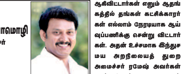
அன்பில் மகேஸ் வாய்யாமொழி முன்னாள் அமைச்சர்

அன்புள்ள மாமாவாக மாறங்கள் சார். உங்களின் பக்கம் நின்று சொன்னால் 'அந்தக் குழந்தைகள் எல்லாரும் உங்களுக்காக வாக்குச் சேகரித்தவர்கள்' என்பதை மறவாதீர்கள் சி.எம். சார். குழந்தைகளின் ஓலம் ஒருபக்கம் என்றால் மின்வெட்டு மக்களை தூக்கமிழக்கச் செய்கிறது. இப்படியே சென்றால் தொழில் நிறுவனங்கள் எப்படி தமிழ்நாட்டை நம்புவார்கள் சார்? முதலில் மக்கள் எப்படி உங்களை நம்புவார்கள்? ஆட்சி என்றால் அரசு கியந்திரம் என்ற ஒன்று உள்ளது என்பதை கட்சிக்காரர்களுக்கு சொல்லிக்கொடுங்கள். தன்னோடு இருந்தவர்கள் எல்லாம் MLA ஆகிவிட்டார்கள். அமைச்சர்