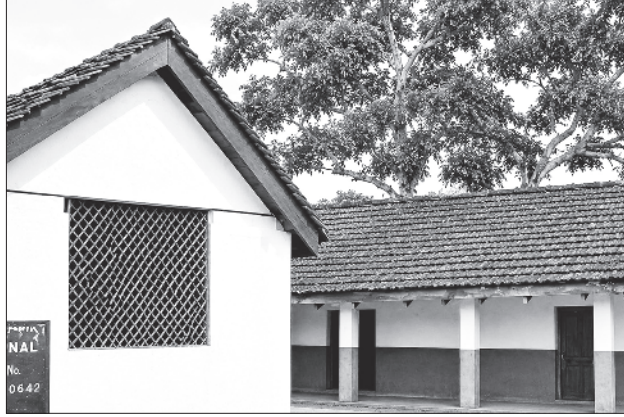
1904-இல் தொடங்கப்பட்ட தாயம்மாள் பெண்கள் பள்ளி