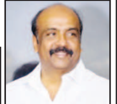
மருது அமுதராசு கழகச் செய்தித் தொடர்புக் குழு துணைத் தலைவர்