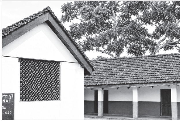
1904-இல் தொடங்கப்பட்ட தாயம்மாள் பெண்கள் பள்ளி

தான் சென்ற ஊரையெல்லாம், வாழ்ந்த பகுதியையெல்லாம் பெரியார் மண்ணாக ஆக்கிட பாடுபட்ட பகுத்தறிவாளர் அவர். அன்றைய நெல்லை மாவட்டம்- இன்றைய தூத்துக்குடி மாவட்டத்தில் உள்ள குல சேகரப்பட்டினத்தை அடுத்த செட்டிகுளத்தில் நெல்லை நாயகம்- வள்ளியம்மை இணையருக்கு 07.10.1878-இல் பிறந்தவர் செ.தெ.நாயகம். குலசேகரப்பட்டினத்தில் உள்ள பள்ளியில்