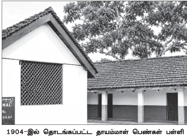
1904-இல் தொடங்கப்பட்ட தாயம்மாள் பெண்கள் பள்ளி

தான் சென்ற ஊரையெல்லாம், வாழ்ந்த பகுதியையெல்லாம் பெரியார் மண்ணாக ஆக்கிட பாடுபட்ட பகுத்தறிவாளர் அவர். அன்றைய நெல்லை மாவட்டம்- இன்றைய தூத்துக்குடி மாவட்டத்தில் உள்ள குல சேகரப்பட்டினத்தை அடுத்த செட்டிசுளத்தில் நெல்லை நாயகம்- வள்ளியம்மை இணையருக்கு 07.10.1878-இல் பிறந்தவர் செ.தெ.நாயகம். குலசேகரப்பட்டினத்தில் உள்ள பள்ளியில்