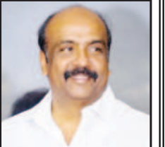
மருது அமுதராசு கழகச் செய்தித் தொடர்புக் குழு துணைத் தலைவர்